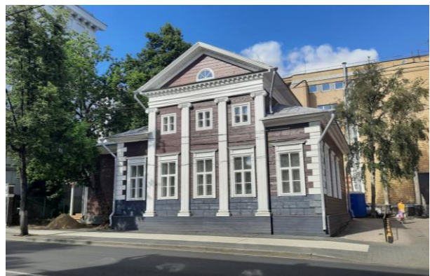
Рис.7. Дом Щелокова на ул. Варварской до и после реставрации в 2022 г.