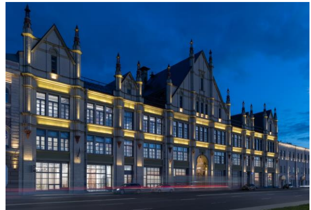
Рис.6. Комплекс банка Рукавишников на Н. Волжской наб. до и после реставрации в 2022 г.