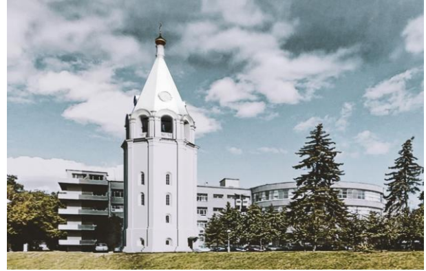
Рис. 5. Колокольня Спасо-Преображенского собора. Фото в начале XX в. и 2021 г.