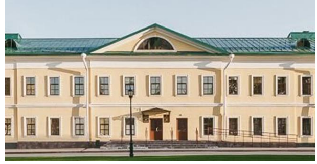
Рис. 4. Казармы гарнизонного батальона. (Кремль, корпус 2) после реставрации в 2021 г.