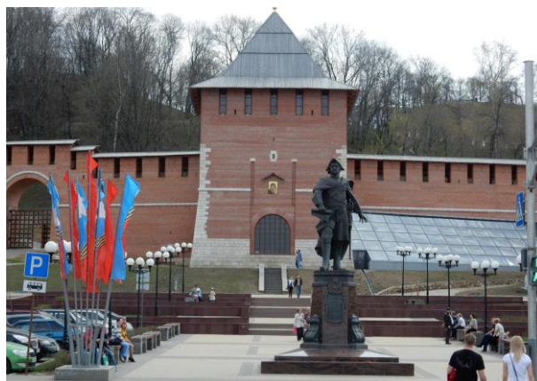
Рис. 1. Зачатьевская башня Нижегородского кремля до и после воссоздания в 2010-е гг.