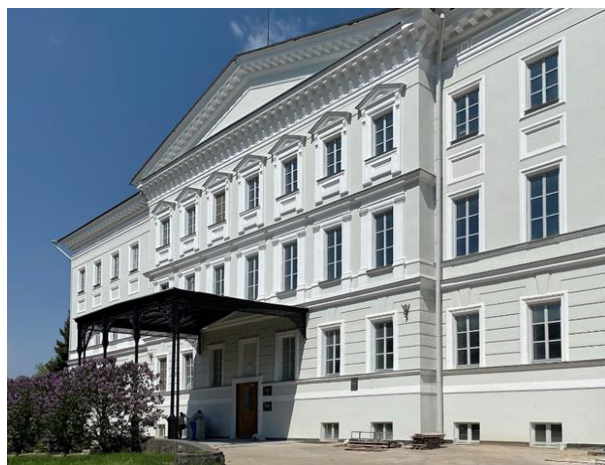
Рис. 2. Дом военного губернатора (Кремль, корпус 3) после реставрации в 2021 г.