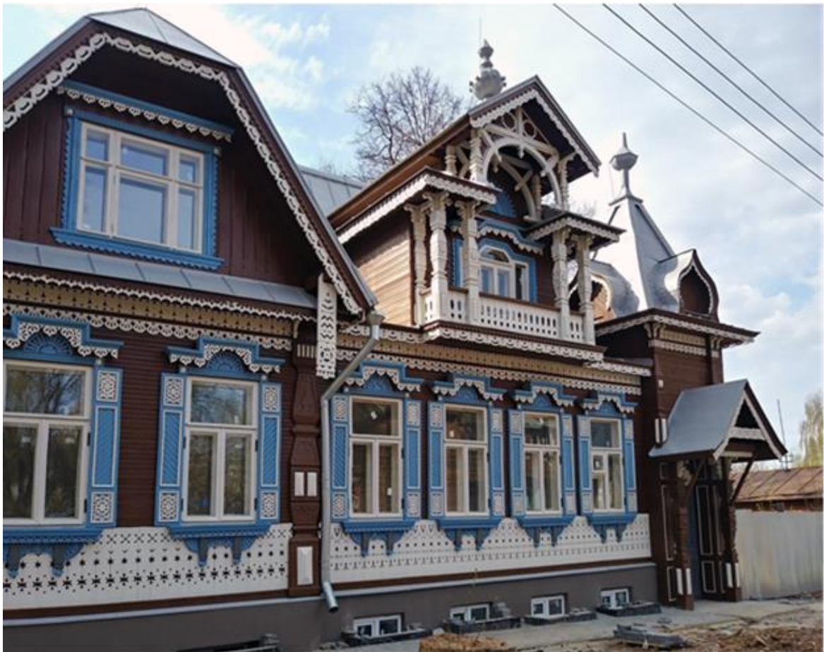
Илл. 4. Воссоздание деревянного дома Смирнова в Нижнем Новгороде в новых материалах.