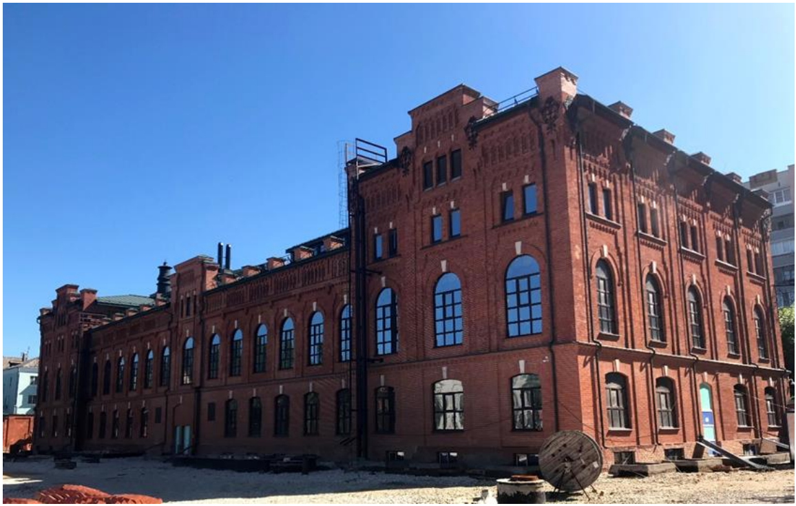
Илл. 3. Реставрация здания водочного завода в Рязани – пример модернизации (конверсии) памятника промышленной архитектуры.