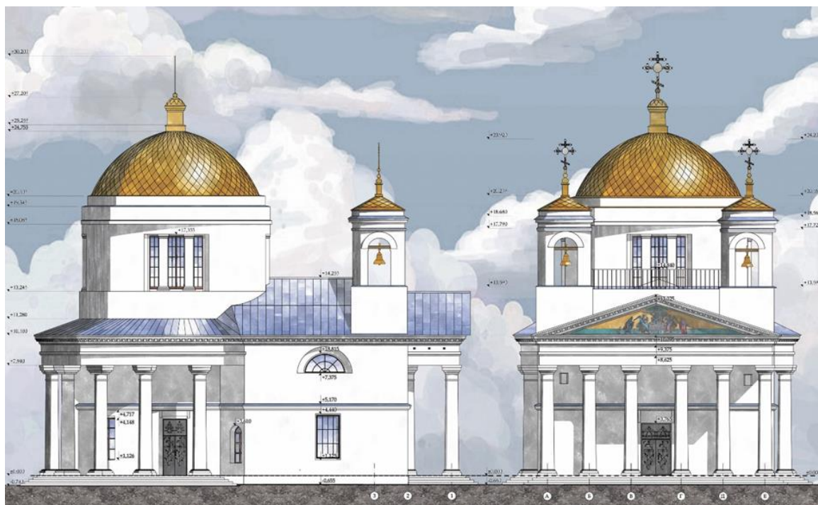
Илл. 2. Комплексный проект реставрации Покровской церкви в с. Борисово-Покровское Нижегородской области.