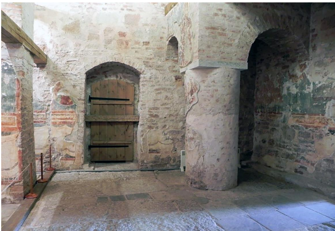
Рис.3. Интерьер церкви Успения на Волотовом поле. Воссоздана в 2000-е гг.