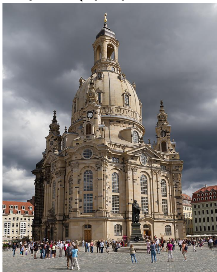
Рис.1. Собор Фрауэнкирхе в Дрездене. Воссоздан в 1990-е гг.