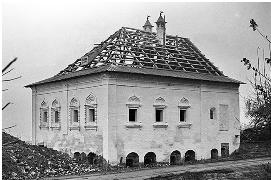
Рис. 2. Северо-восточный корпус Благовещенского монастыря в процессе реставрационных работ 1978 – 1983 гг.

работы носили характер консервации с элементами стилистической реставрации [5].