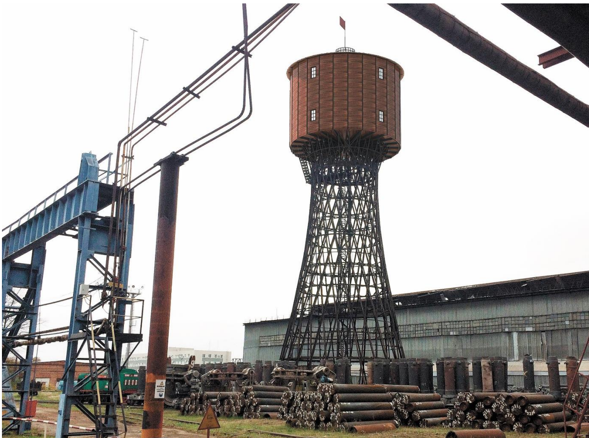
Рис. 4. Реставрация Водонапорной башни Усадьбно-промышленного комплекса в г. Выксе Нижегородской области.