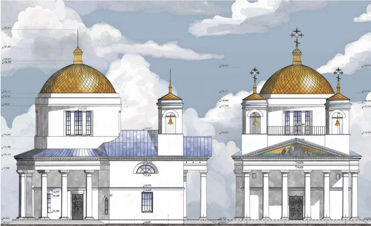
Рис. 1. Проект реставрации Покровской церкви в с. Борисово-Покровское Нижегородской области.