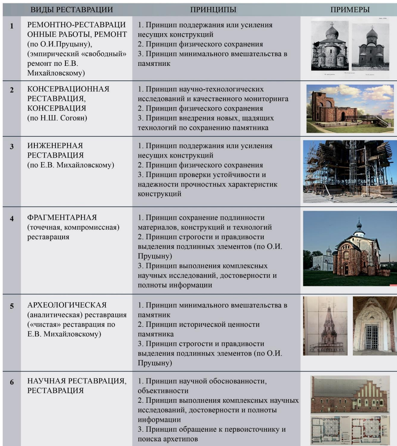
Рис. 3. Сводная таблица видов и принципов реставрации XIX - XXI вв.