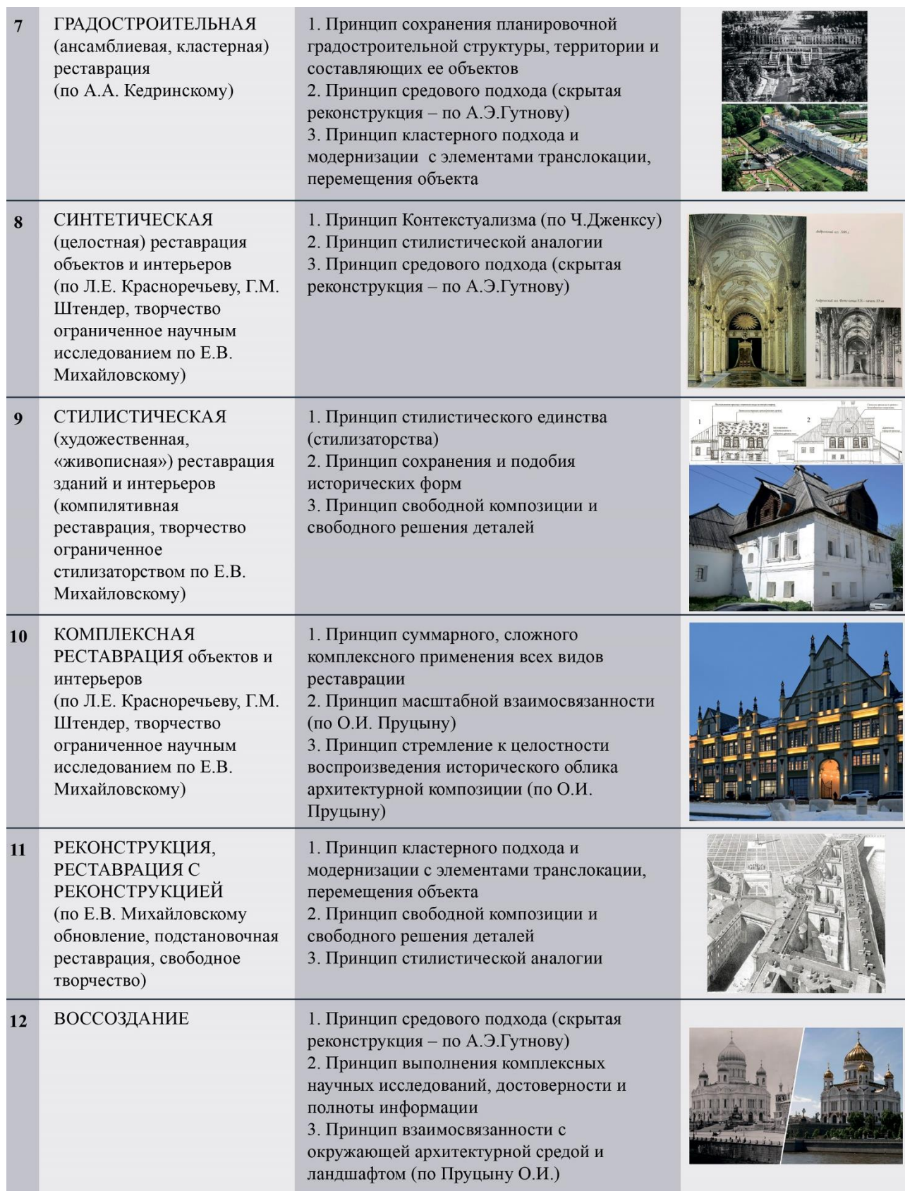
Рис. 4. Сводная таблица видов и принципов реставрации XIX - XXI вв. (продолжение)