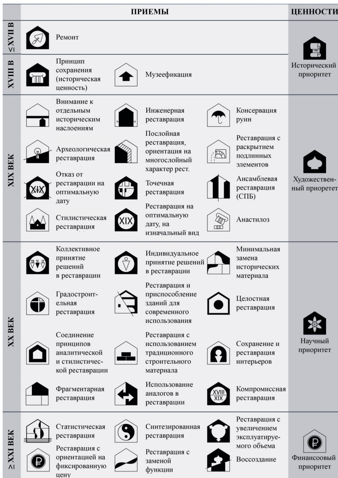
Рис. 2. Схема формирования ценностных аспектов реставрации в хронологическом контексте. Развитие приемов реставрации.