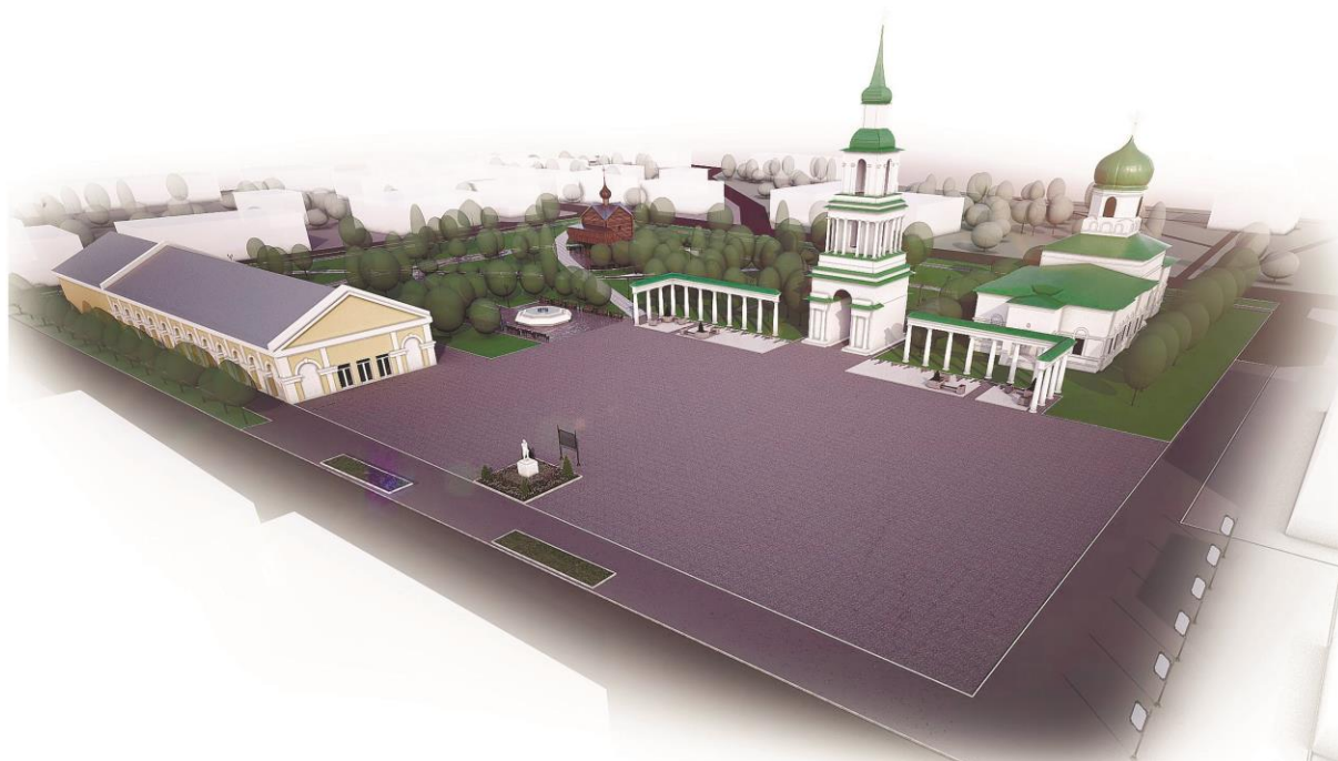
Рис. 2. Панорама центральной части г. Слободского. 2018 г.