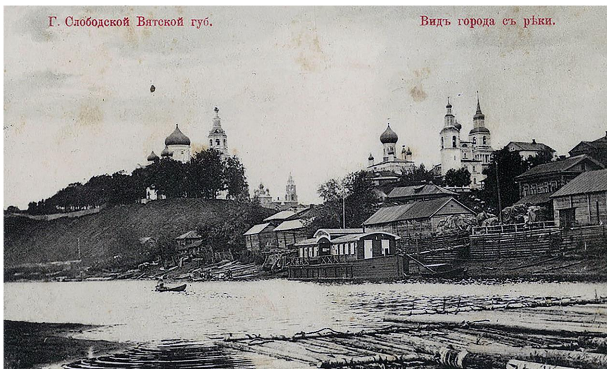
Рис. 1. Панорама центральной части г. Слободского в начале XX в.