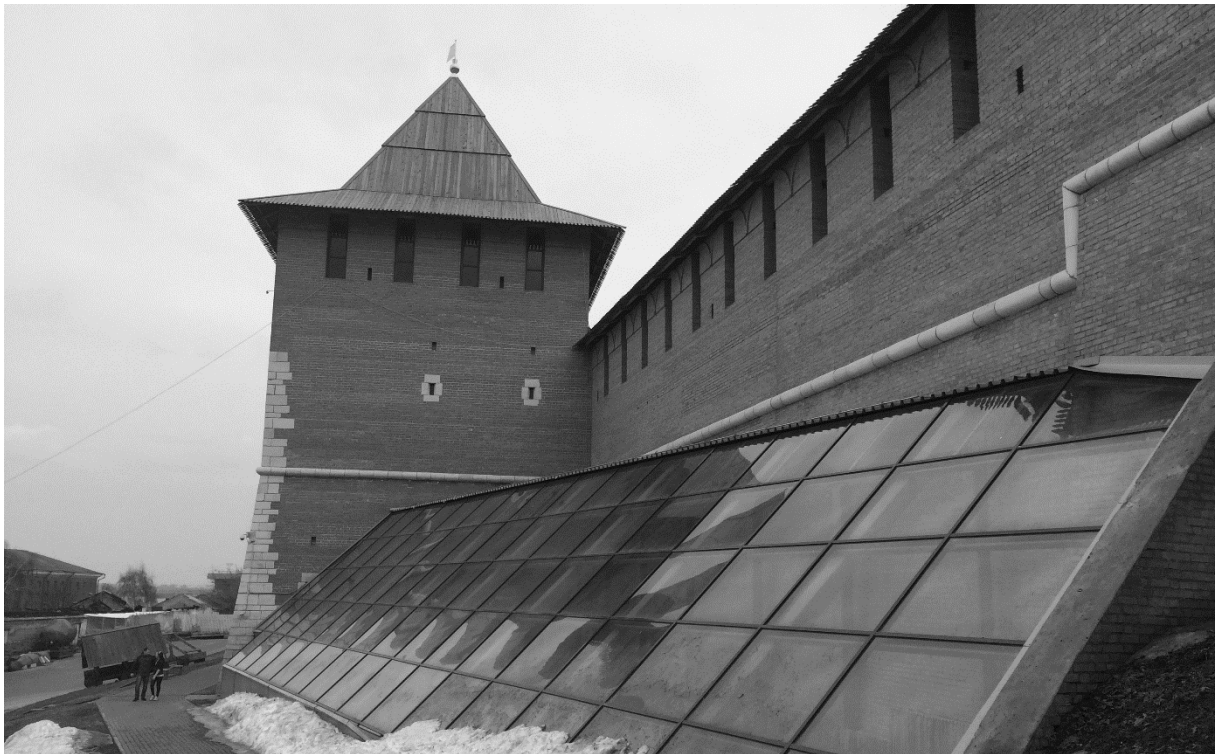
Рис.2 Зачатская башня Нижегородского кремля (XVI в.). Восстановлена в 2008 – 2014 гг. ООО НИП «Этнос», ООО «Старый Нижний Новгород». Стилистическая реставрация с консервацией археологических остатков древних стен.