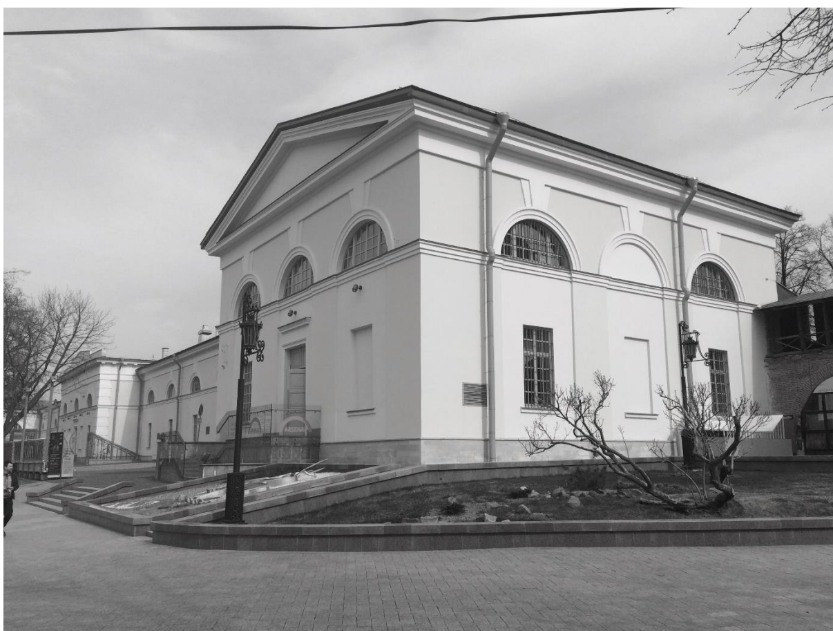
Рис.4 Здание Арсенала в Нижегородском кремле (1843 г.). Восстановлен в 2007 – 2014 гг. «СПЕЦПРОЕКТРЕСТАВРАЦИЯ», ООО «Архитекторы Асс», ЗАО «СМУ-77». Фрагментарная реставрация с раскрытием подлинных конструкций.