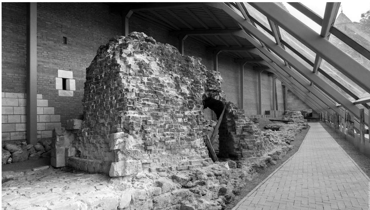
Рис.3 Зачатская башня Нижегородского кремля (XVI в.). Восстановлена в 2008 – 2014 гг. ООО НИП «Этнос», ООО «Старый Нижний Новгород». Стилистическая реставрация с консервацией археологических остатков древних стен.