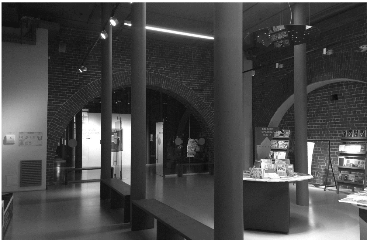
Рис.5 Здание Арсенала в Нижегородском кремле (1843 г.). Восстановлен в 2007 – 2014 гг. «СПЕЦПРОЕКТРЕСТАВРАЦИЯ», ООО «Архитекторы Асс», ЗАО «СМУ-77». Фрагментарная реставрация с раскрытием подлинных конструкций.