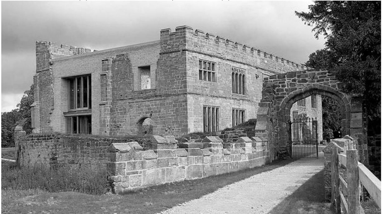
Рис.1 Замок Эстли в Уоркшире (Англия, XII в.). Восстановлен в 2010-х гг. Арх. бюро Witherford Watson Mann Architects. Реставрация выполнена на основе археологического метода с сохранением подлинных руинированных стен памятника.