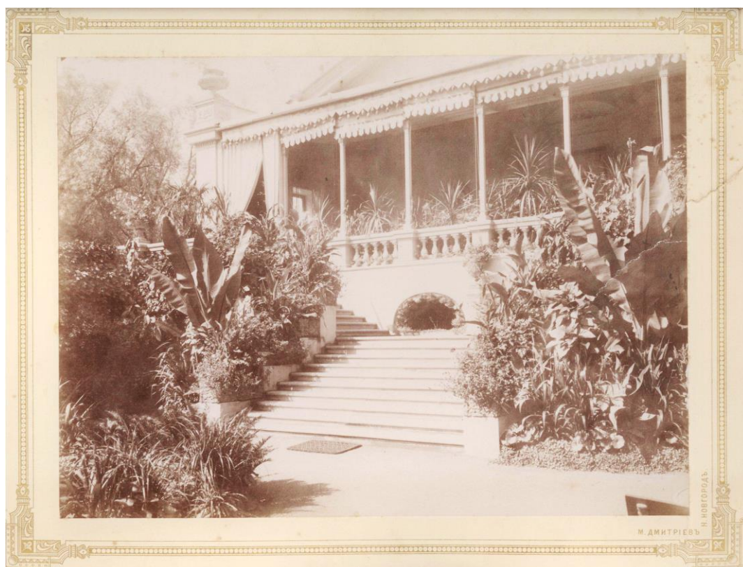
Рис. 1. Особняк В.М. Бурмистровой. Веранда. Фото кон. XIX – нач. XX вв.

Усадебный парк предположительно занимал часть квартала, выходившего на противоположную сторону улицы Провиантской.