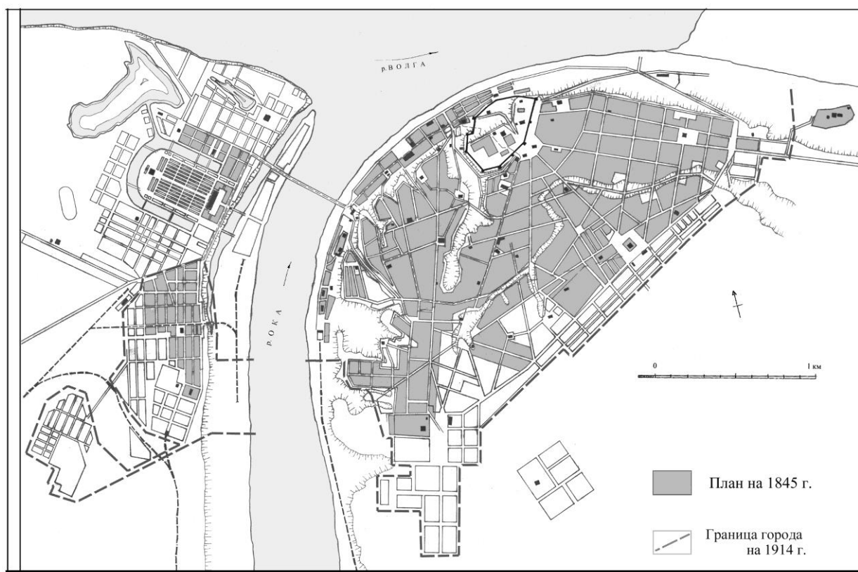
Рис. 1. План Нижнего Новгорода и ярмарки с указанием границ города на 1914 г. На плане тоном отмечена территория города на 1845 г. Чертеж автора.

В этот же период формировалась набережная и на территории ярмарки за счет застройки крупными торговыми зданиями и постройками культового назначения. Линия набережной была продолжена и в районе Канавино, который оказался в зоне влияния ярмарки. застройка здесь велась небольшими жилыми домами с частичным включением домов гостиничного и торгового назначения (рис. 1).