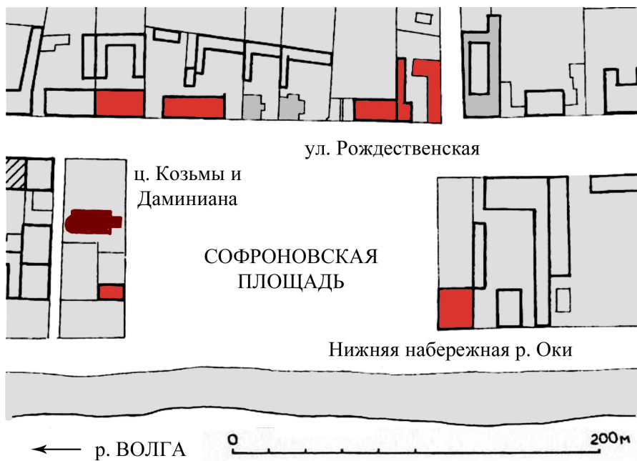
Рис. 2. Софроновская площадь